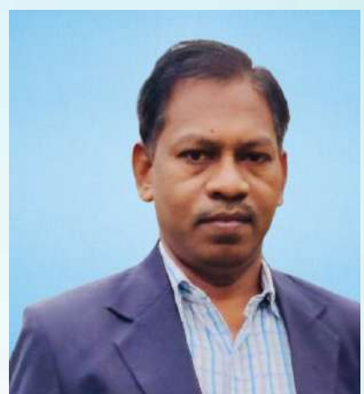
ಉತ್ಕೃಷ್ಟ ಸಹಿ ಸಹಿ ಸಹಿ