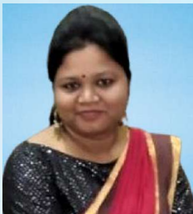
ಉತ್ಕೃಷ್ಟ ಸಹಿ ಸಹಿ ಸಹಿ