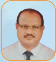
යන.ඒ එච්එන් රාජරාජරාජ