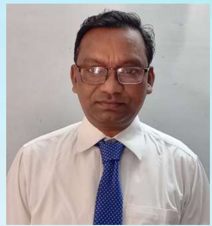
ಉತ್ಕೃಷ್ಟ ಸಹಿ ಸಹಿ ಸಹಿ