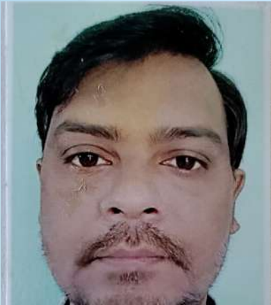
ಉತ್ಕೃಷ್ಟ ಸಹಿ ಸಹಿ ಸಹಿ