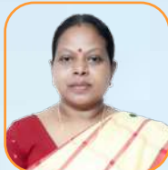
යන.ඒ.ඩී. එච්එන් රාජරාජරාජ