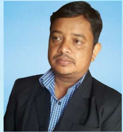
ಉತ್ಕೃಷ್ಟ ಸಹಿ ಸಹಿ ಸಹಿ