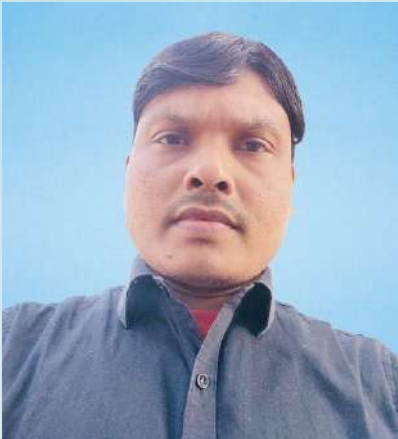
ಉತ್ಕೃಷ್ಟ ಸಹಿ ಸಹಿ ಸಹಿ