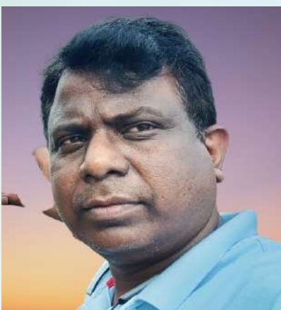
ಉ.ಪಂಚಾಯತ್ ಉಪಾಧ್ಯಕ್ಷರಾಗಿ ನೌಕರಾದವರ ಪರಿಚಯ