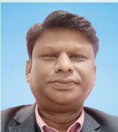
ಉತ್ಕೃಷ್ಟ ಸಹಿ ಸಹಿ ಸಹಿ