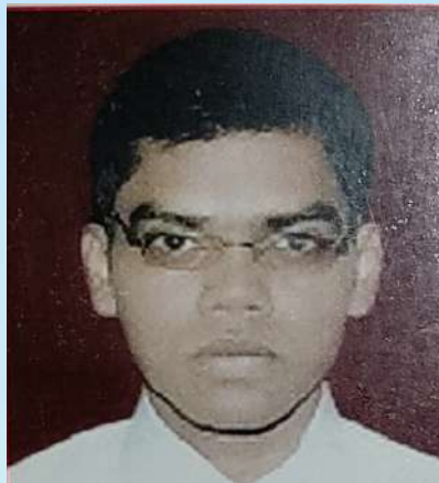
ಉ.ಪಂಚಾಯತ್ ಉಪಾಧ್ಯಕ್ಷರಾಗಿ ನೌಕರಾದವರ ಪರಿಚಯ