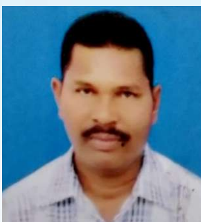
ಉ.ಪಂಚಾಯತ್ ಉಪಾಧ್ಯಕ್ಷರಾಗಿ ನೌಕರಾದವರ ಪರಿಚಯ