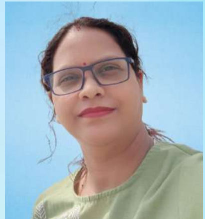
ಉ.ಪಂಚಾಯತ್ ಉಪಾಧ್ಯಕ್ಷರಾಗಿ ನೌಕರಾದವರ ಪರಿಚಯ