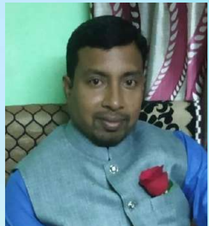
ಉ.ಉ. ಉದ್ದೇಶಪೂರ್ವಕವಾಗಿ ನಮಗಾಗಿ