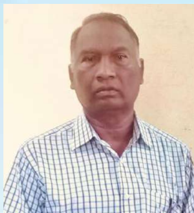
ಉ.ಪಂಚಾಯತ್ ಉಪಾಧ್ಯಕ್ಷರಾಗಿ ನೌಕರಾದವರ ಪರಿಚಯ