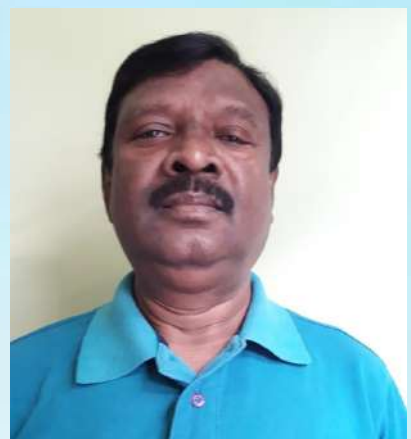
ಉ.ಪಂಚಾಯತ್ ಉಪಾಧ್ಯಕ್ಷರಾಗಿ ನೌಕರಾದವರ ಪರಿಚಯ