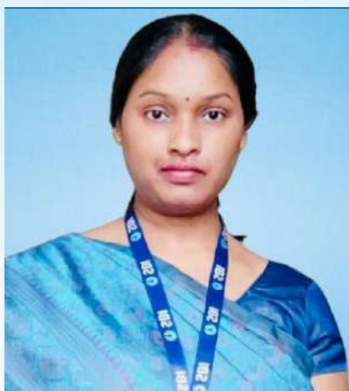
ಉತ್ಕೃಷ್ಟ ಸಹಿ ಸಹಿ ಸಹಿ