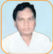
යන.ඒ එච්එන් රාජරාජරාජ