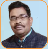
යන.ඒ එච්එන් රාජරාජරාජ