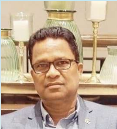
ಉ.ಉ. ಉದ್ದೇಶಪೂರ್ವಕವಾಗಿ ನಮಗಾಗಿ