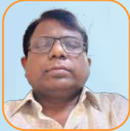
යන.ඒ රාජරාජ රාජරාජරාජ