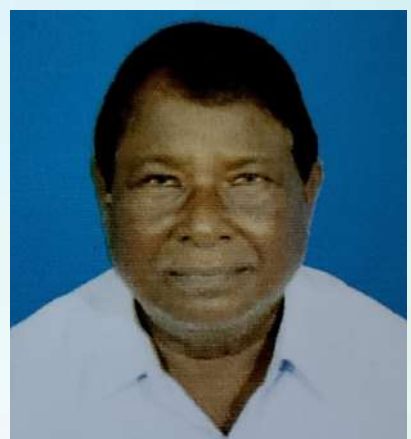
ಉ.ಪಂಚಾಯತ್ ಉಪಾಧ್ಯಕ್ಷರಾಗಿ ನೌಕರಾದವರ ಪರಿಚಯ