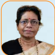
යන.ඒ.ඩී. රාජරාජ රාජරාජරාජ