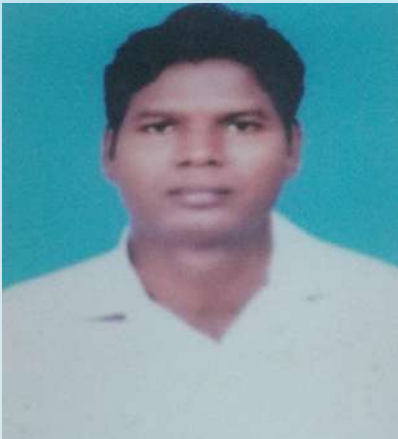
ಉ.ಪಂಚಾಯತ್ ಉಪಾಧ್ಯಕ್ಷರಾಗಿ ನೌಕರಾದವರ ಪರಿಚಯ