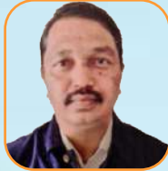
යන.ඒ රාජරාජ රාජරාජරාජ