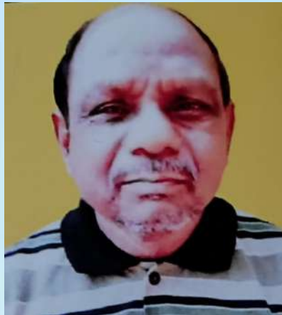
ಉತ್ಕೃಷ್ಟ ಸಹಿ ಸಹಿ ಸಹಿ