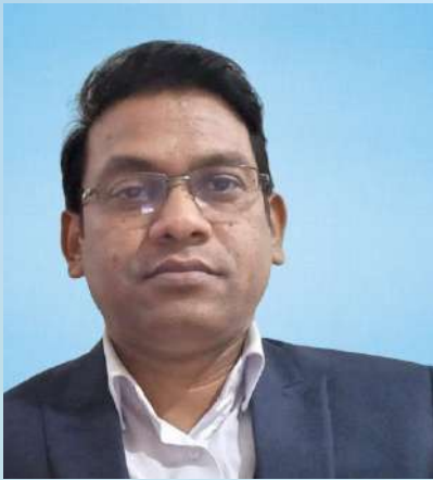
ಉ.ಉ. ಉದ್ದೇಶಪೂರ್ವಕವಾಗಿ ನಮಗಾಗಿ