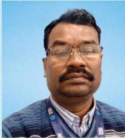
ಉ.ಉ. ಉದ್ದೇಶಪೂರ್ವಕವಾಗಿ ನಮಗಾಗಿ