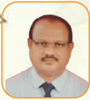
යන.ඳ එච්චන් වැටුප්පව