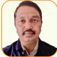
යන.ඳ ජයවර්ධන වැටුප්පව