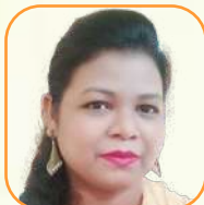
යන.ඳ ජයවර්ධන වැටුප්පව