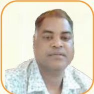
යන.ඳ දේවනන් වැටුප්පව