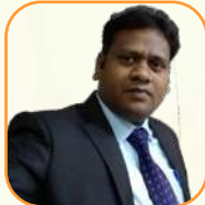
යන.ඳ තනු වනන් වැටුප්පව