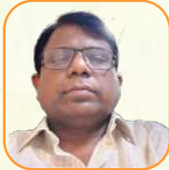
යන.ඳ ජයවර්ධන වැටුප්පව