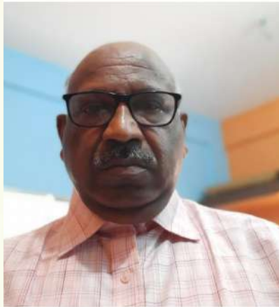
ම.ම. ම.ම.ම. ම.ම.ම.ම.ම. ම.ම.ම.ම.ම.