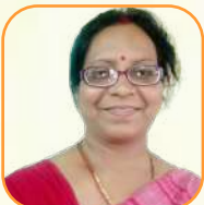
යන.ඳ ජයවර්ධන වැටුප්පව