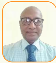
යන.ඳ තනු වනන් ගනව්ව