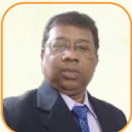
යන.ඳ වැටුප්පව වැටුප්පව