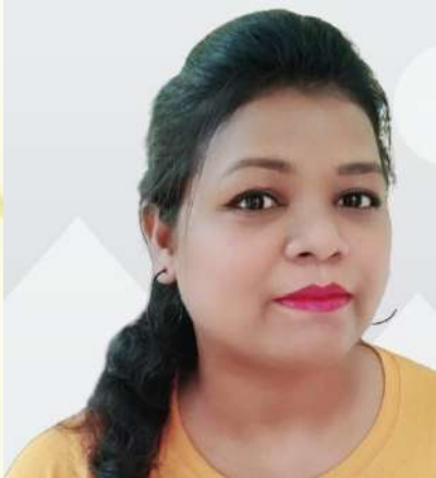
ම.ම.ම.ම.ම. ම.ම.ම.ම.ම. ම.ම.ම.ම.ම.