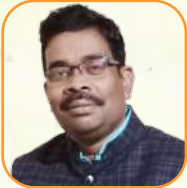
යන.ඳ එච්චන් වැටුප්පව