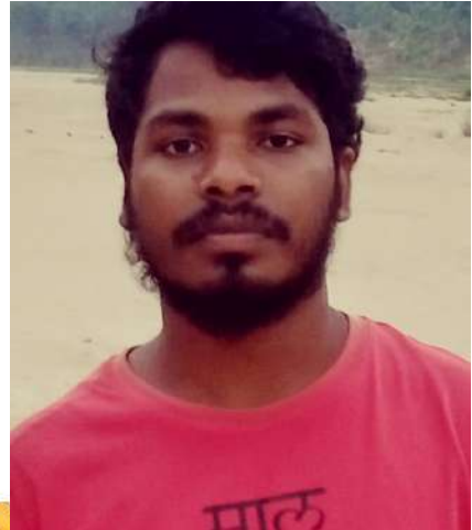
ච.ච ච.චචච චචචචචච චචචචච චචචචචච

ඛචචච චචචචච චචචච චචචචච චච චචචච චචචචච චචචච |