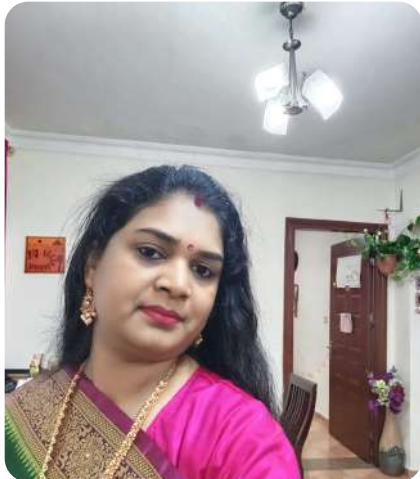
චචන.චචච.ච චනචචච චචච,චන.චච

ඛචන-ඛචන-ඛචන,ඛචන.චච ඛචනචච, චචචචච චචචචච චචචච චචචචච |