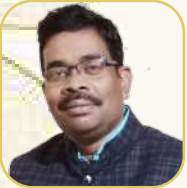
යන.ඒ රාන්ජිත් සාහිත්‍ය