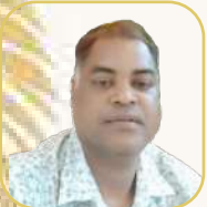
යන.ඒ ගුණපාච්ඡන් සාහිත්‍ය