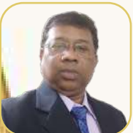
යන.ඒ රාන්ජිත් සාහිත්‍ය