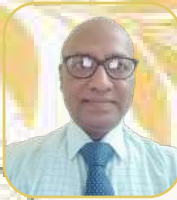
යන.ඒ නිශාන් සාහිත්‍ය