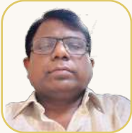
යන.ඒ ගුණපාච්ඡන් සාහිත්‍ය