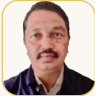
යන.ඒ ගුණපාච්ඡන් සාහිත්‍ය