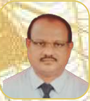
යන.ඒ චන්දන සාහිත්‍ය