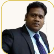
යන.ඒ නිශාන් සාහිත්‍ය