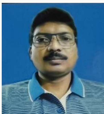
ಮ.ಉ. ಸೀನಿವಾಸ ಮ.ಉ.ಉ