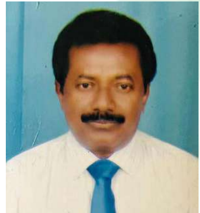
මානව සම්පත් ජනප්‍රියතම මානව සම්පත්