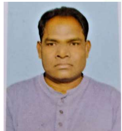
මානව සම්පත් ජනප්‍රියතම මානව සම්පත්