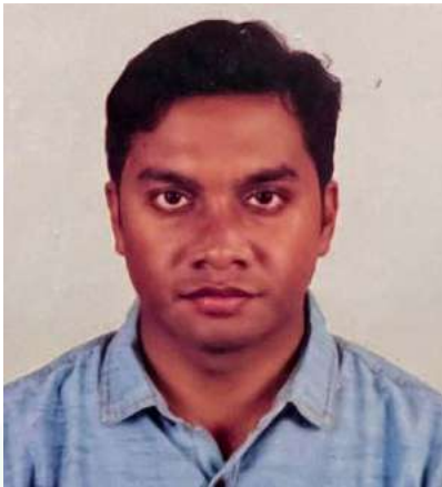
මානව සම්පත් ජනප්‍රියතම මානව සම්පත්