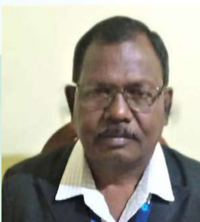
මානව සම්පත් ජනප්‍රියතම මානව සම්පත්