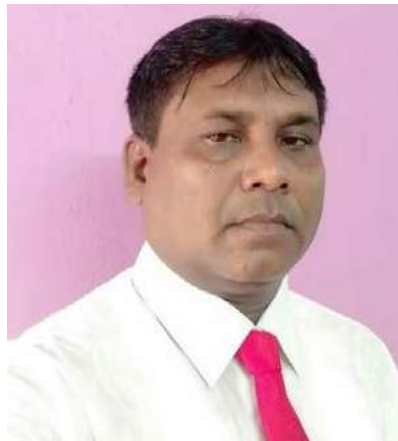
මානව සම්පත් ජනප්‍රියතම මානව සම්පත්