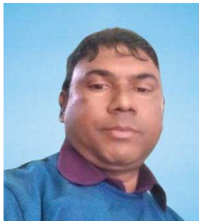
මානව සම්පත් ජනප්‍රියතම මානව සම්පත්