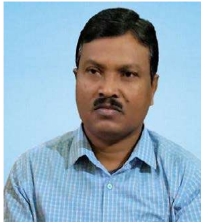
මානව සම්පත් ජනප්‍රියතම මානව සම්පත්