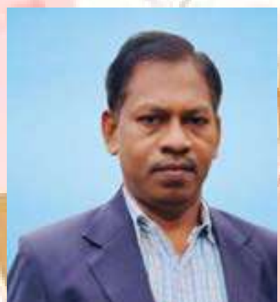
ಉತ್ತಮ ಉತ್ತಮ ಉತ್ತಮ