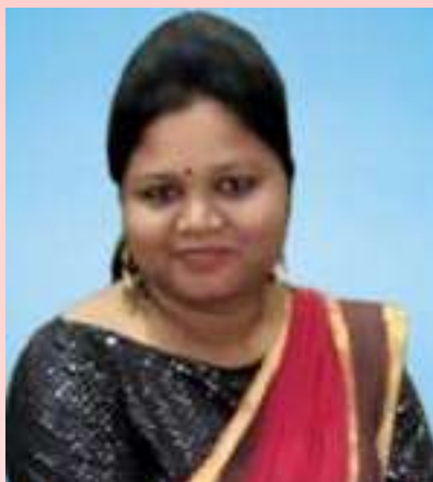
ಉತ್ತಮ ಉತ್ತಮ ಉತ್ತಮ