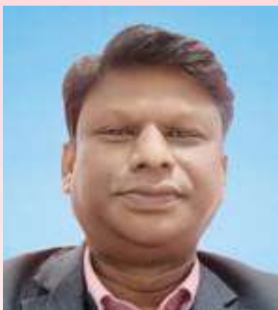
ಉತ್ತಮ ಉತ್ತಮ ಉತ್ತಮ