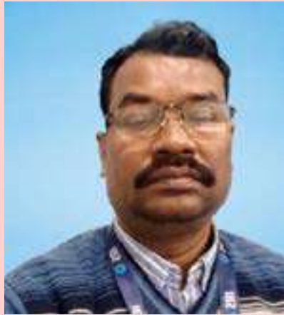
ಉ.ಉ ಉದಯೋನ್ಮುಖವಾಗಿ ನಾಯಕ