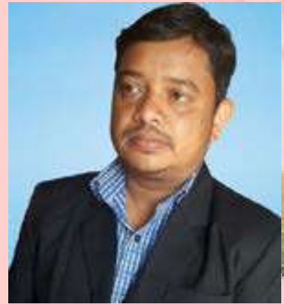
ಉತ್ತಮ ಉತ್ತಮ ಉತ್ತಮ