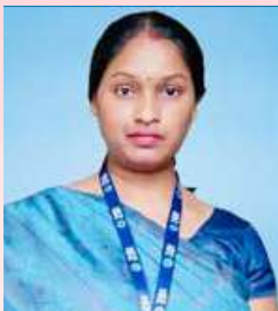
ಉತ್ತಮ ಉತ್ತಮ ಉತ್ತಮ