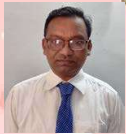
ಉತ್ತಮ ಉತ್ತಮ ಉತ್ತಮ