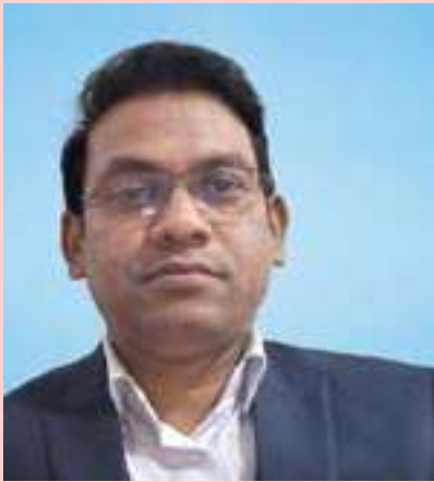
ಉ.ಉ ಉದಯೋನ್ಮುಖವಾಗಿ ನಾಯಕ