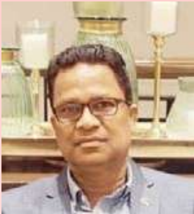
ಉ.ಉ ಉದಯೋನ್ಮುಖವಾಗಿ ನಾಯಕ