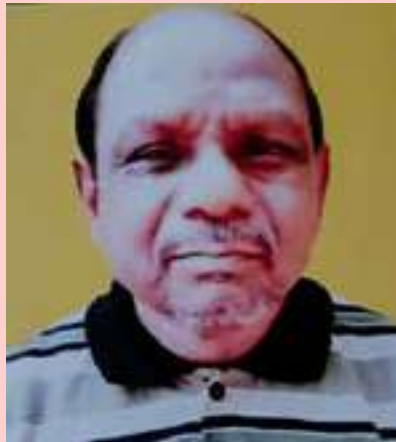
ಉತ್ತಮ ಉತ್ತಮ ಉತ್ತಮ