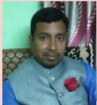
ಉ.ಉ ಉದಯೋನ್ಮುಖವಾಗಿ ನಾಯಕ