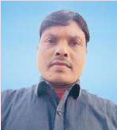
ಉತ್ತಮ ಉತ್ತಮ ಉತ್ತಮ