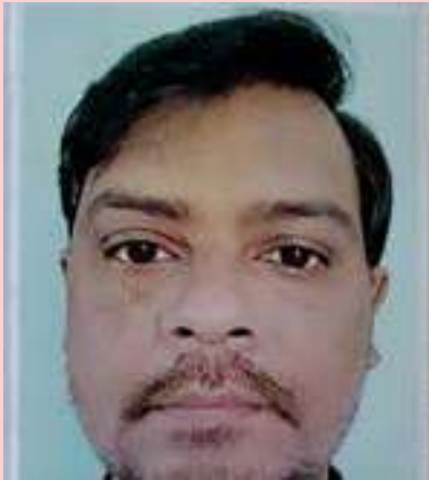
ಉತ್ತಮ ಉತ್ತಮ ಉತ್ತಮ