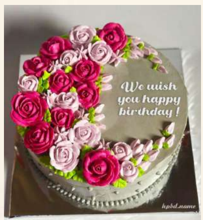
ඃන.ඉෳඃ ඉහඃන.ෳෳෳ ඛන'උඉඃ