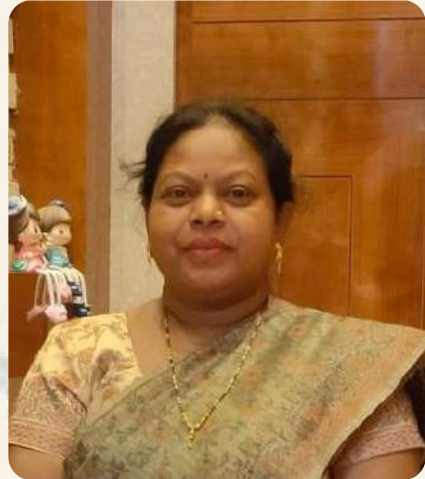
ආචාර නිවැරදි ලිවීමේ විද්වතු ඉසන

ඉසන.බට්ටා බැලෙනවිට නිළ බැට පැනවන ආචාර-බැලෙනවිට නිළ බැට පැනවන බැලෙනවිට ඉසන.බට්ටා බැලෙනවිට බැලෙනවිට බැලෙනවිට, බැලෙනවිට. බැලෙනවිට ।