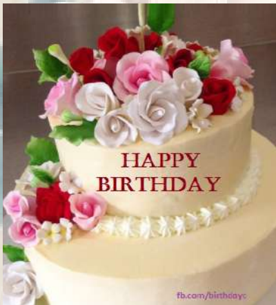
ඃන.ඉ ඃඃඉඃඃඃ ඃනඃනඉඉෳෳ