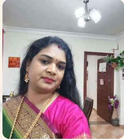
ධන.උනලේ ලේ ධන.උනලේ ලේ ලේ, බනවන

මන.0, ධන.ලේ.බ්, ධන.බ් ධන.ලේ, උනලේ ලේ-ලේ.බ් න.බ් න.බ් න, වචන-වචන ධනදන ලේ.බ්, බනවන, හලේ.බ් ලේ බනවන 0267 ධන.බ්