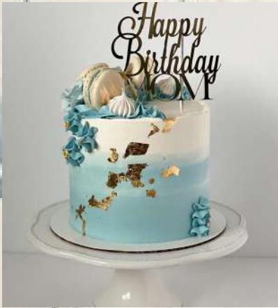
ඃන.ඉ හෳඋඉඃ හහඃනඃ ඃහඃඃඃ