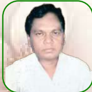
යන.උ උපකරණ වර්මාසාන