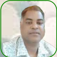
යන.උ ඉරිසා වර්මාසාන