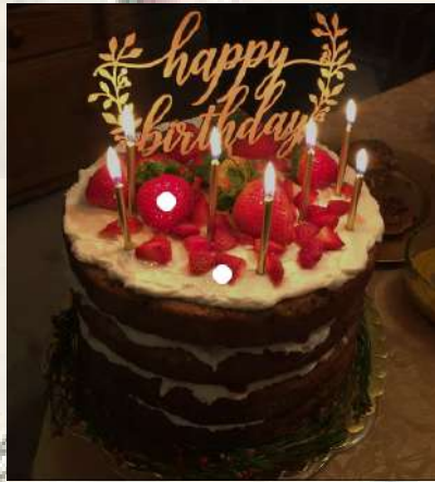
ඃන.ඉ ඃඉෳඃ හහඃනඃ ඃනඃනඉඉෳෳ