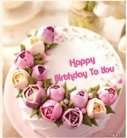
ඃන.ඉෳඃ උහඃඃෳෳ හෳඋඃඃ