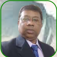
යන.උ වර්මාසාන වර්මාසාන