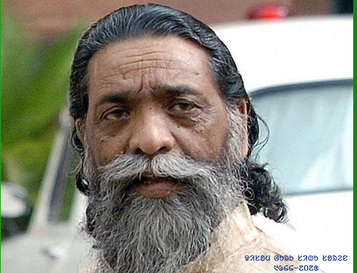
ଫଟୋ ଗ୍ରହଣ କରାଯାଇଛି ୧୫-୧୨୫

ଏହି ପତ୍ରିକାଟି ୧୫-୧୨୫ ଉପରେ ପ୍ରକାଶିତ ହେଉଥିବା ALL INDIA SANTAL BANK EMPLOYEES' WELFARE SOCIETY (AISBEWS)