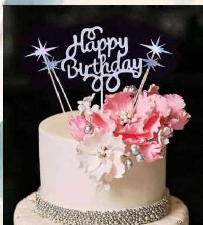
ඃන.ඉ නඉඃඉඉඉ හෳඋඉඃ උඃඃ2ඉ