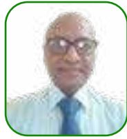
යන.ඒ තනඋ යචත ආනචච