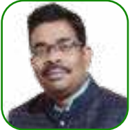
යන.ඒ භචචන උචචන යන'උචන