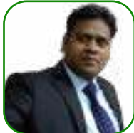
යන.ඒ තනචන යැපැවූවන