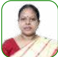
යන.ඒ උචචන ආනචන