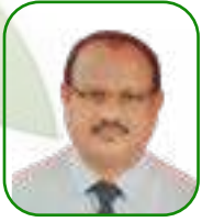
යන.ඒ උච්චත යැපැවූවන