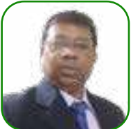
යන.ඒ යනචන යන.චච