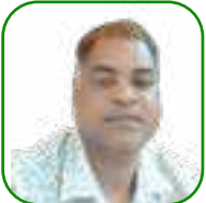
යන.ඒ උචචන යන.චච