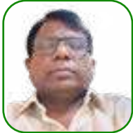
යන.ඒ උචචන යන'උචන