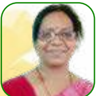
යන.ඒ යනචන ආනචන