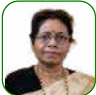
යන.ඒ උචචන යන.චච