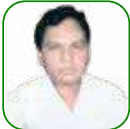
යන.ඒ උචචන යන'උචන