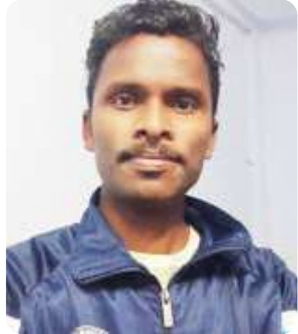
මන.උ උදවුන මාලවන

මාලවන මන.උ මාලවන මාලවන මාලවන මාලවන මාලවන මාලවන මාලවන මාලවන මාලවන මාලවන