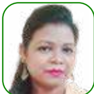
යන.ඒ උචචන චච