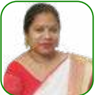
යන.ඒ උචචන යන.චච