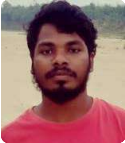
මන.උ උපුකු මාලවන