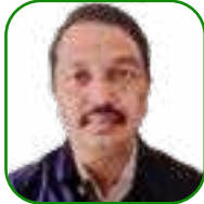
යන.ඒ උචචන යන.චච